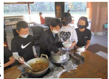
5年生宿泊研修 カレー作り