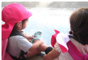
私が、サンダル履かせてあげる