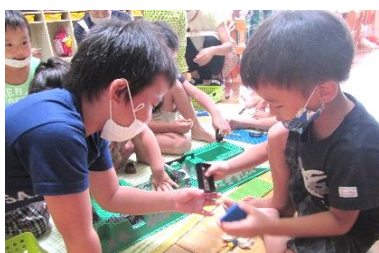
組み立て方を教えてあげるよ！

一緒にブロックを作ってくれたお兄さん。優しく声をかけてくれたお姉さん。そんな姿を見て、きっとまた来年に繋がっていくのでしょうか。誰にでも優しくできる子、思いを伝えられる子に育ってほしいと思います。