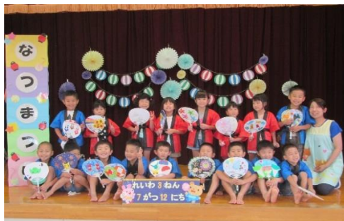
ぞうぐみさん、こども園最後の夏まつりでした。