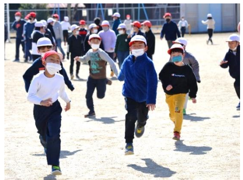
元気いっぱい「北っ子」

さて、通知表や卒業証書を手に持って、子どもたちはどんな表情でお家に帰ってきたのでしょうか。私は令和4年度をスタートさせる1年前の4月から「卒業式・修了式の日こんな子どもの顔であってほしい」と思い描きながら学校を運営してきました。私が思い描いていた子どもの姿は次のようなものでした。