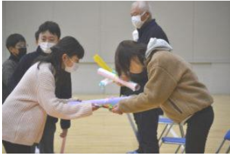
北小学校 給食感謝の会 全校集会で感謝の手紙や

先日、各学校の児童生徒の代表から、普段給食に携わってくださる学校の校務員さん、給食補助員さん、そして、給食センターの調理員さんたちに感謝の手紙をいただきました。中3は、給食新聞を作り給食川柳を考えてくれました。(裏面に紹介)