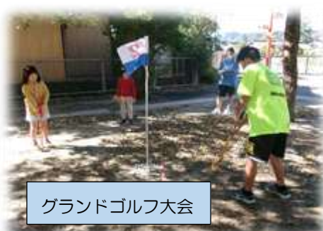
グランドゴルフ大会