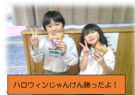
ハロウィンじゃんけん勝ったよ！